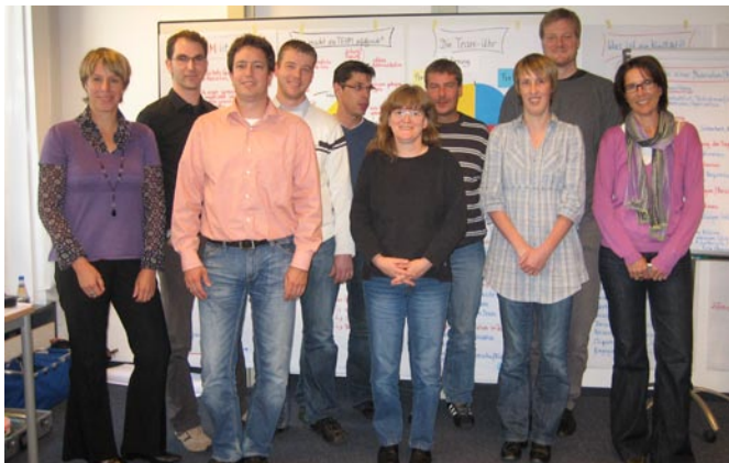
Zum „Führungskräfte-Entwicklungsprogramm“ treffen sich Vertreter der zehn Unternehmen viermal im Jahr bei PE 3 .