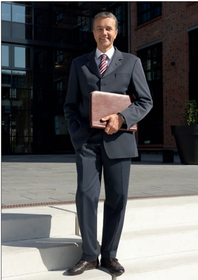
Unternehmer können mit dem ESF ihre Marktposition stärken.

bis Oktober 2012 laufenden Projekts sind kleine und mittlere Hamburger Unternehmen, deren wirtschaftliche Situation angespannt ist. Dienstleister und Ansprechpartner ist die Handelskammer Hamburg, die in den kommenden Monaten für diese Betriebe eine Vielzahl von Leistungen entwickeln wird. Dazu gehören individuelle Übersichten über spezielle Beratungs- und Fördermöglichkeiten für KMU in Krisensituationen, Beratung beispielsweise bei der Sanierung von Betrieben, sowie die Einrichtung einer zentralen Beratungsstelle und eines Beratershops im Internet.