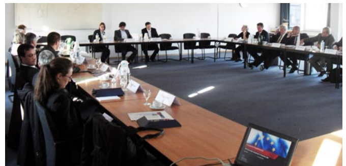
Erfolgreicher Auftakt der Veranstaltungsreihe „ESF-Branchentalk“.

Weitere ESF-Branchentalks in den kommenden Monaten sollen die Anforderungen verschiedener Branchen an ESF-Projekte ausloten. Bei der nächsten Diskussionsrunde am 28. Oktober geht es um die Wachstumsbranche „Gesundheitswirtschaft“.