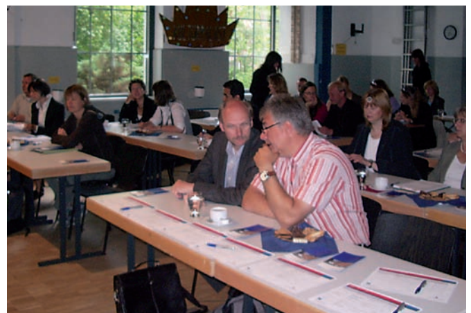
Projektträger und Antragsteller informieren sich über die Förderfibel

Einsehbar ist die Förderfibel auf www.esf-hamburg.de