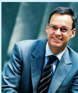
Ihr Axel Gedaschko Senator für Wirtschaft und Arbeit