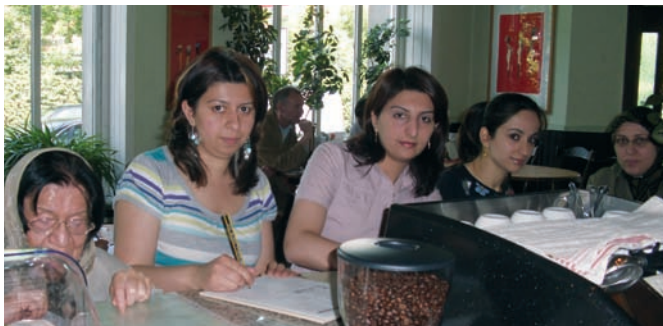
Projektteilnehmerinnen beim Deutschunterricht

In der Freien und Hansestadt Hamburg leben mehrere Tausend Flüchtlinge. Ihre Möglichkeiten, an Aus- und Weiterbildungsmaßnahmen teilzunehmen oder eine Beschäftigung zu finden, sind begrenzt. Wesentlicher Grund dafür ist der ungesicherte Aufenthaltsstatus und die fehlende Arbeitserlaubnis. Spezielle Projekte unterstützen deshalb gezielt Flüchtlinge. Eines davon ist das vom Europäischen Sozialfonds geförderte „AQUABA für Flüchtlinge“, das in drei verschiedenen Einrichtungen durchgeführt wird.